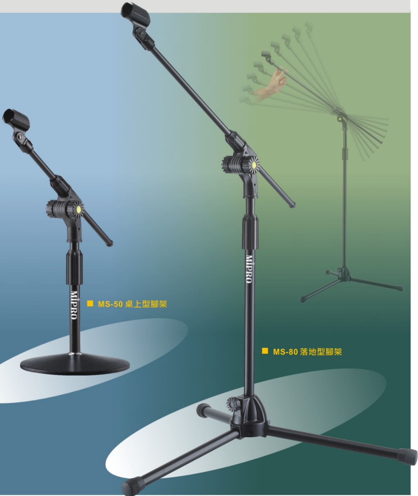
■ MS-50 桌上型腳架

符合美學設計，高精密製程之麥克風腳架，是一把專業且使用上非常簡易的麥克風架。榮獲多國專利，擁有極佳的活動性，可隨心所欲調整最佳使用角度和高度，最能滿足您任何工作場合的信任與需求，勝任舞台每場最完美的演出!